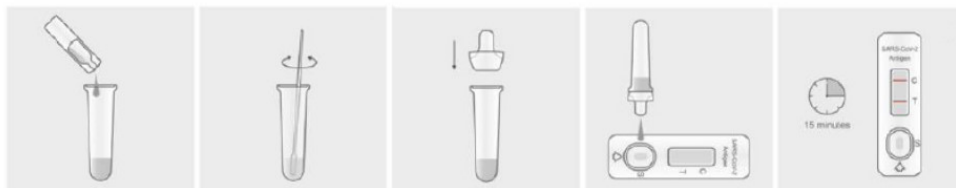
Abbildung 2: Extraktionspuffer einfüllen